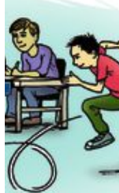
Kul eller jobbigt att byta skola? Sidan 10.